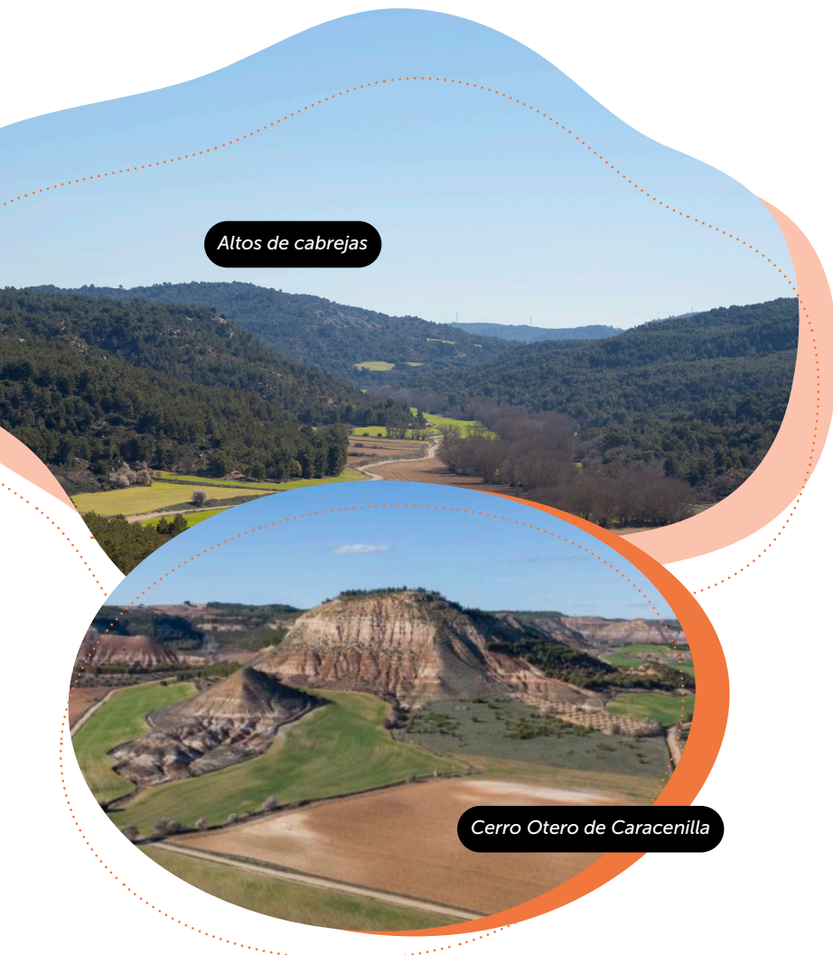
Altos de cabrejas