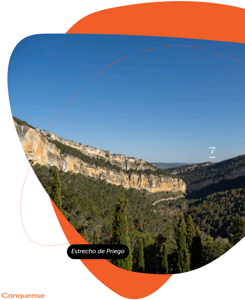
Estrecho de Priego

Como elementos diferenciales al relieve descrito con anterioridad son los puntos de unión entre los Montes de Toledo y el Sistema Ibérico, extremo oriental de la comarca (Sierra de Bascañana). Y por el extremo opuesto, el más cercano a la depresión del Tajo, la Sierra de Altomira, de menor altitud, aunque de vertiente muy cortada, como señala José Luís García Grinda en su libro La arquitectura popular de La Alcarria Conquense.