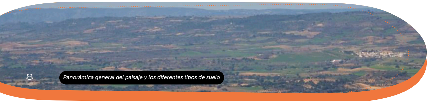
Panorámica general del paisaje y los diferentes tipos de suelo

Los grupos de suelos más representativos son: