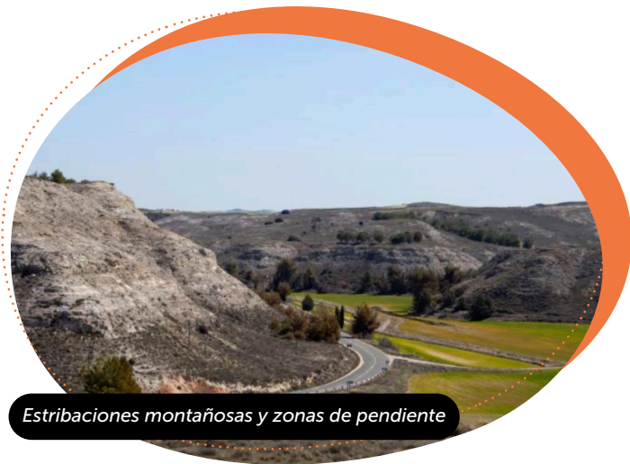
Estribaciones montañosas y zonas de pendiente

El terreno se originó durante un largo periodo de sedimentación sobre un lago interior (cuenca endorreica) a partir de la erosión de los sistemas montañosos que flanquean la comarca (Sistema Central y Sistema Ibérico) y sus estribaciones montañosas (Sierra de Altomira y Bascuñana).