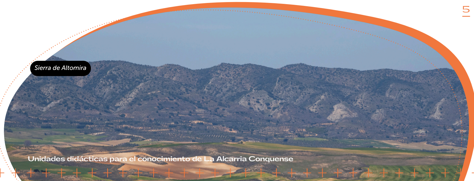
Sierra de Altomira

Los procesos erosivos a lo largo de millones de años tras la orogenia Alpina y la fuerte erosión provocada por los ríos Tajo y Guadiela han configurado el relieve actual de la la Sierra de Altomira, caracterizada por formaciones abruptas y escarpadas.