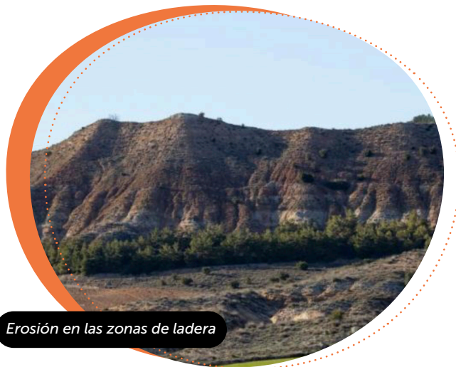
Erosión en las zonas de ladera

El terreno se originó durante un largo periodo de sedimentación sobre un lago interior (cuenca endorreica) a partir de la erosión de los sistemas montañosos que flanquean la comarca (Sistema Central y Sistema Ibérico) y sus estribaciones montañosas (Sierra de Altomira y Bascuñana).