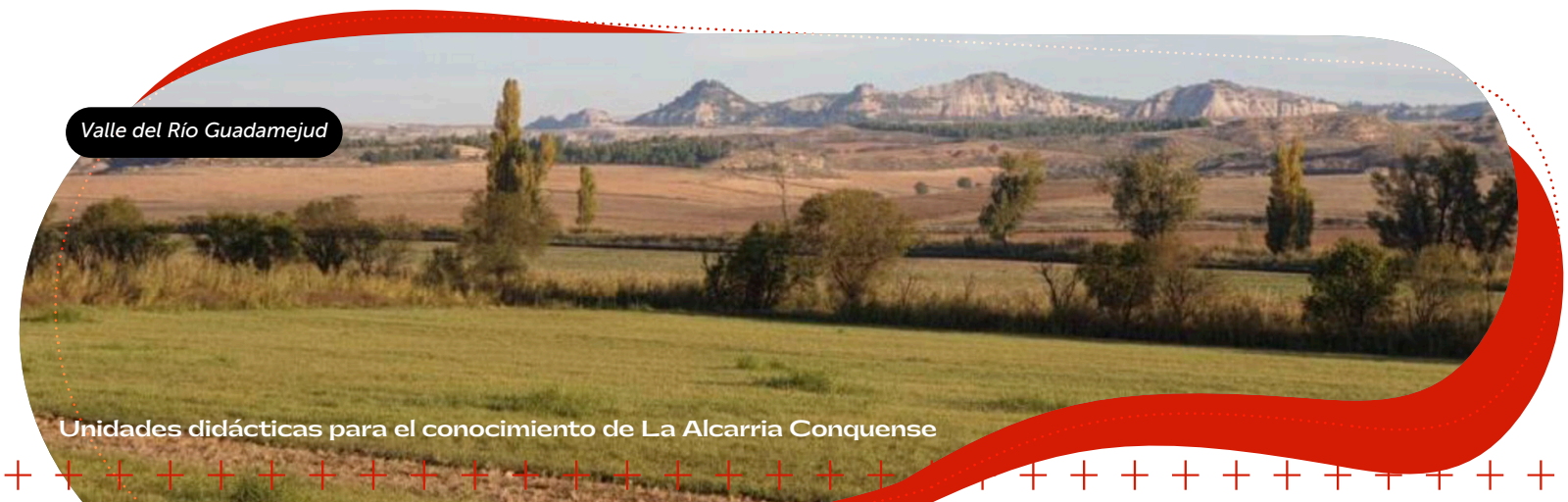
Valle del Río Guadamejud

Discurre por un paisaje muy típico de características lunares, con grandes formaciones de materiales blandos (yesos, areniscas y margas, principalmente) que el paso del tiempo y las erosiones del agua y el viento han moldeado de manera característica.