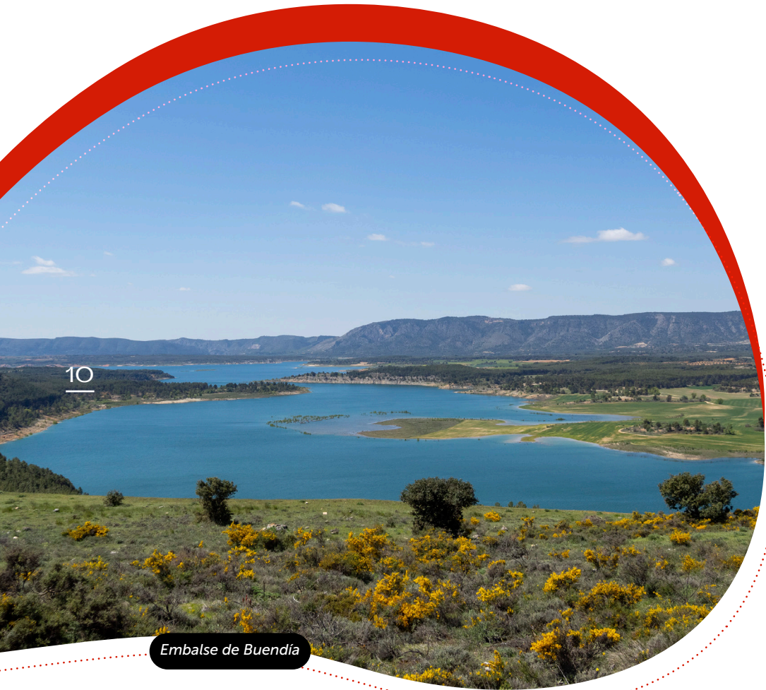
Embalse de Buendía

El recorrido del río Guadiela desde la presa del embalse de Buendía hasta la ermita de nuestra señora de los Desamparados discurre por un sendero señalizado el PR-47, donde se pueden disfrutar del entorno, del agua, la vegetación de ribera y los farallones calizos, aptos para el desarrollo de la actividad de escalada. En la actualidad ya hay una serie de vías abiertas. Cabe destacar el bosque ribera o galería que posee y el estado de conservación en el que se encuentra. Debajo del pantano se encuentra el municipio de Santa María de Poyos, como dato de interés, cuando el caudal del pantano baja se puede caminar por sus calles, de igual modo ocurre con el balneario de la Isabela, del que se hizo una miniserie "La memoria del agua".